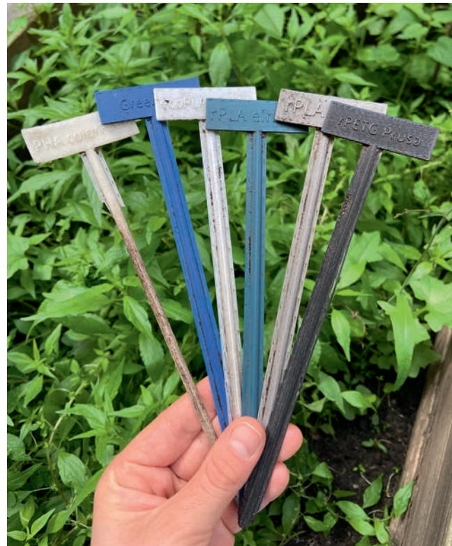
Experimente zur Kompostierbarkeit von PLA für 3D-Drucker nach 6 Monaten.

Mit unserem eigens entwickelten Circular Design Sprint fördern wir bei Kindern und Jugendlichen das Bewusstsein für zirkuläres Produktdesign. Sie lernen, Prototypen und Produkte so zu gestalten, dass Materialien möglichst lange und in hoher Qualität im Umlauf bleiben. In