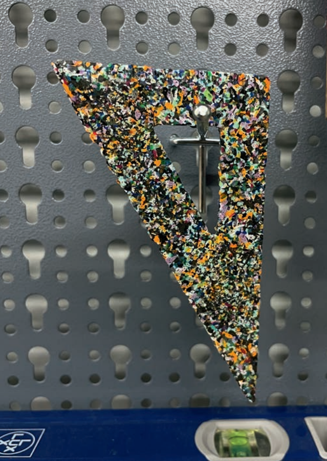
Dreieck aus recyceltem Plastik aus dem Backofen.