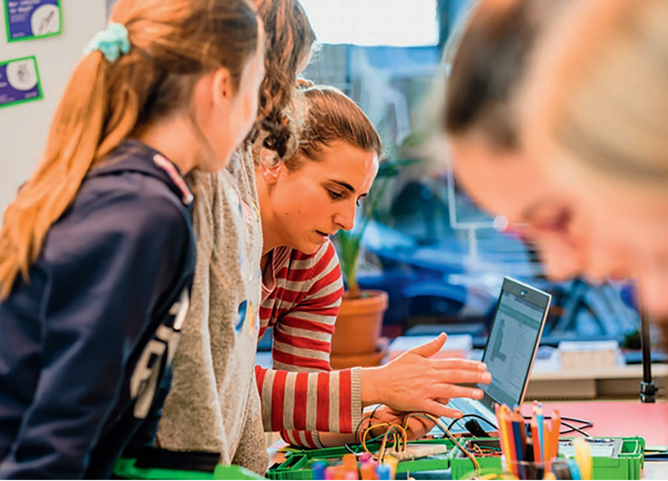
Tüftelnde Kinder im TüftelLab.