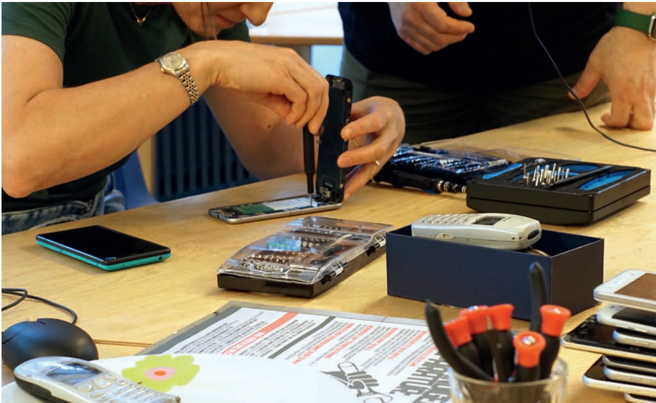
Workshop zur Reparierbarkeit von Handys.

Die Gestaltung eines Ortes beeinflusst maßgeblich das Lernerlebnis der Nutzenden. Deshalb streben wir danach, unseren Makerspace nach den Prinzipien der Circular Economy auszurichten. Als gemeinnütziges Unternehmen mit begrenzten Ressourcen verfolgen wir dabei einen pragmatischen Ansatz. Wir haben Maßnahmen identifiziert, die sowohl besonders wichtig als auch direkt beeinflussbar sind – insbesondere in den Bereichen Reinigung, Materialbeschaffung und Technik.