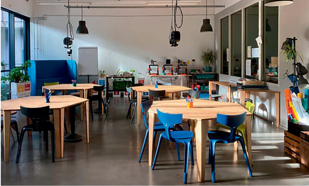
Die Räume des TüftelLab Berlin